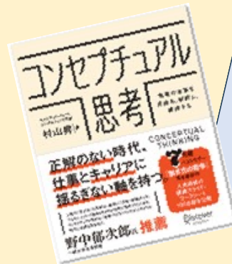
続編姉妹本 『コンセプチュアル思考〈入門ワークブック〉』 （仮タイトル）の出版を計画中

こうした受講者の答案を紙面に生かす手法は、これまでも拙著『働き方の哲学』『スキルペディア』で採用してきました。受講生のみなさんと次の書籍を一緒につくりあげていく、これが「第0期ミッション」です。